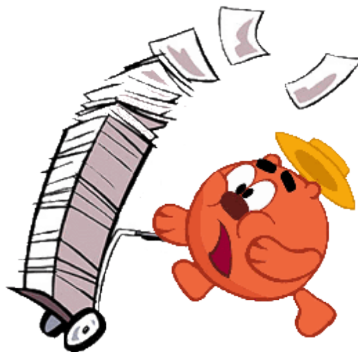
График работы: пн - пт: с 09:30 до 18:30. Сб: с 09:30 до 17:30